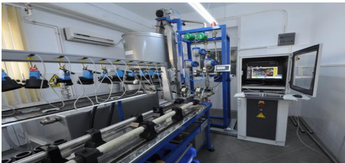
Stand verificare contori