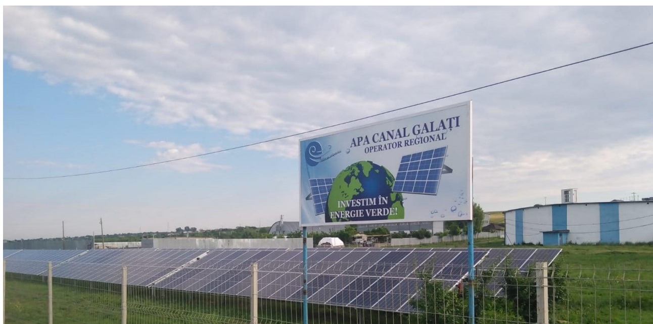
Panouri fotovoltaice Șerbești